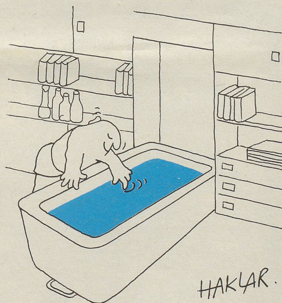
Sommerhit: Studio mit Einbaubad

Alles auf dieser Welt kann man rückgängig machen, bloss nicht das Wissen.