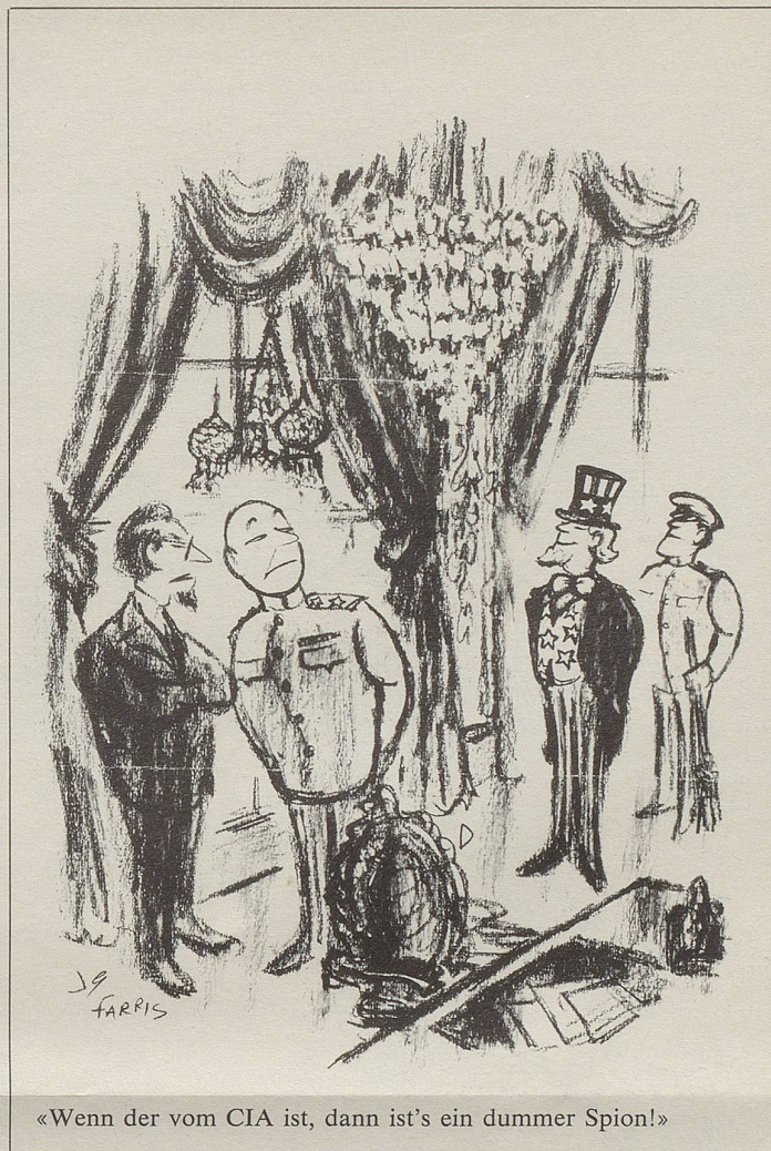
«Wenn der vom CIA ist, dann ist's ein dummer Spion!»

Man konnte auch ohne Lockheed zu Geld kommen. Der Historiker Duruy sagte von Mazarin: «Ein grosser Diplomat, aber kein grosser Minister. Em Ende seines Lebens betrug die Staatsschuld 430 000 000 Francs, sein Privatvermögen aber 100 000 000 Francs. Und so konnte denn auch einmal ein Minister zum König sagen: «Sire, in Ihrem Schatz ist kein Geld, aber der Herr Kardinal kann Ihnen etwas leihen.»