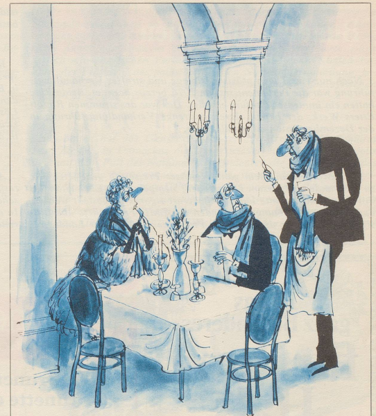
«Etwas empfehlen? Vielleicht Kamillente mit Aspirin?!»