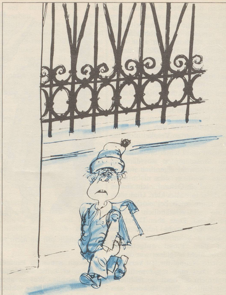
«Alle haben Grippe, nur ich nicht!»

Grippe klingt volkstümlich, Influenza hat so etwas von einem italienischen Badestrand.