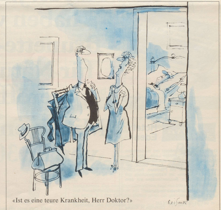
«Ist es eine teure Krankheit, Herr Doktor?»