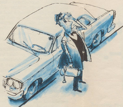
«Es sieht nicht nach Grippe aus – ich komme hinauf!»