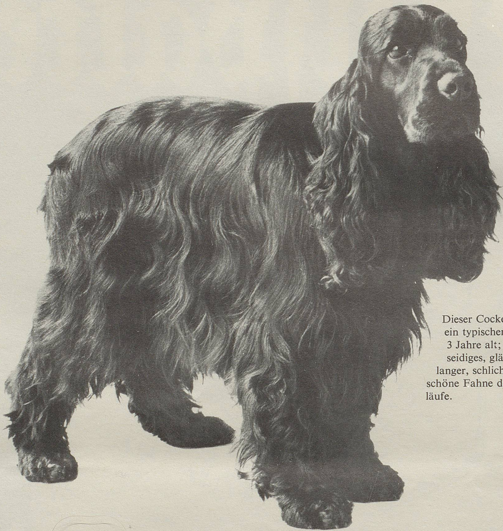
Dieser Cocker Spaniel ist ein typischer Chappi-Hund: 3 Jahre alt; 12 kg schwer; seidiges, glänzendes Fell; langer, schlichter Behang, schöne Fahne der Vorderläufe.