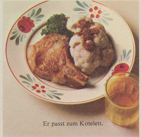
Er passt zum Kotelett.