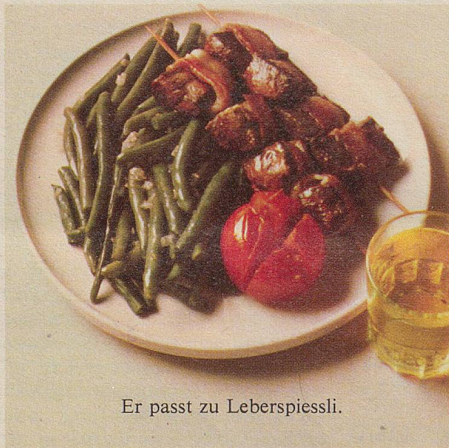
Er passt zu Leberspiessli.