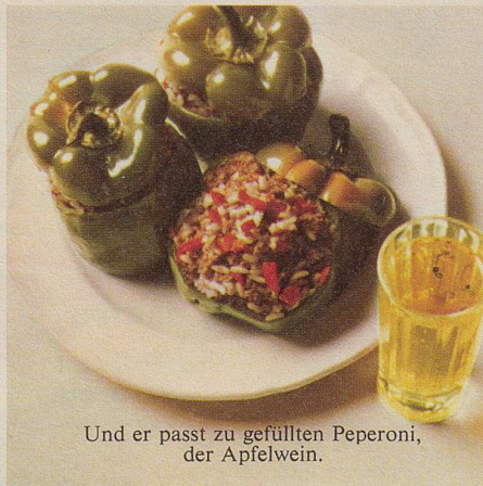
Und er passt zu gefüllten Peperoni, der Apfelwein.

Natürlich bekommen Sie nicht überall den gleichen Apfelwein. Und es ist auch nicht jeder Apfelwein gleich wie der andere. Aber wenn Sie überall wieder einen probieren, dann merken Sie, was wir meinen, wenn wir sagen: Schweizer Apfelwein, das ist Vielfalt mit Charakter.