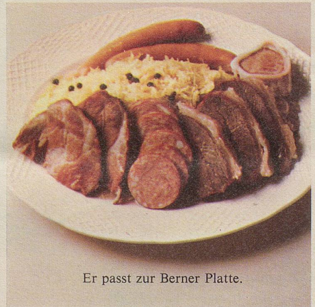
Er passt zur Berner Platte.