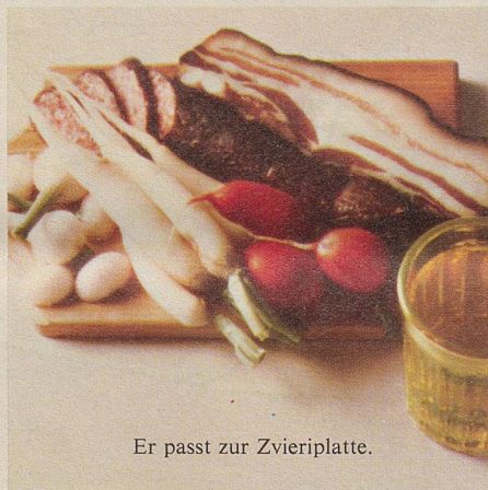
Er passt zur Zvieriplatte.