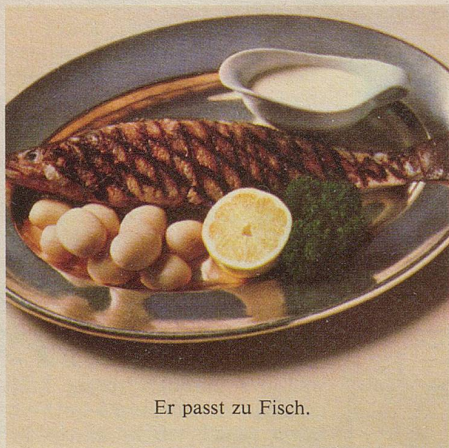
Er passt zu Fisch.