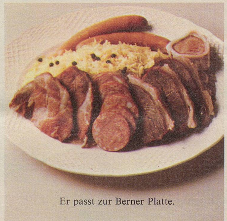
Er passt zur Berner Platte.