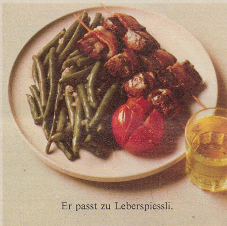
Er passt zu Leberspiessli.