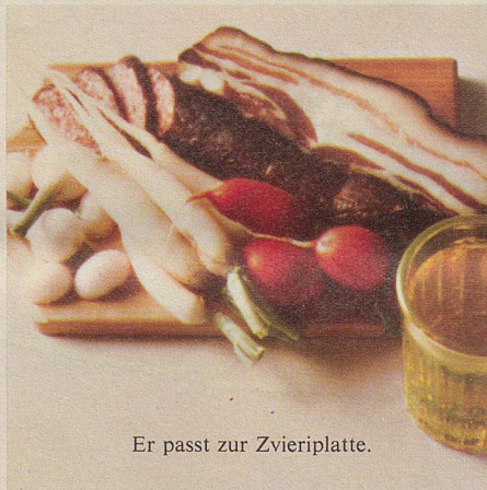
Er passt zur Zvieriplatte.