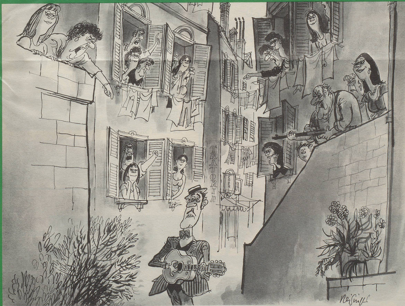
«Heraus mit der Sprache: Für wen ist die Serenade bestimmt!?»