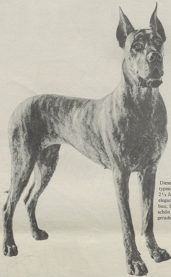
Diese Deutsche Dogge ist ein typischer Chappi-Hund: 2 1/2 Jahre alt; 44 kg schwer; eleganter, kräftiger Körperbau; breite Brust, langer, schön geschwungener Hals; gerade und starke Läufe.