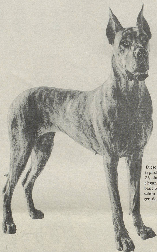
Diese Deutsche Dogge ist ein typischer Chappi-Hund: 2 1/2 Jahre alt; 44 kg schwer; eleganter, kräftiger Körperbau; breite Brust, langer, schön geschwungener Hals; gerade und starke Läufe.