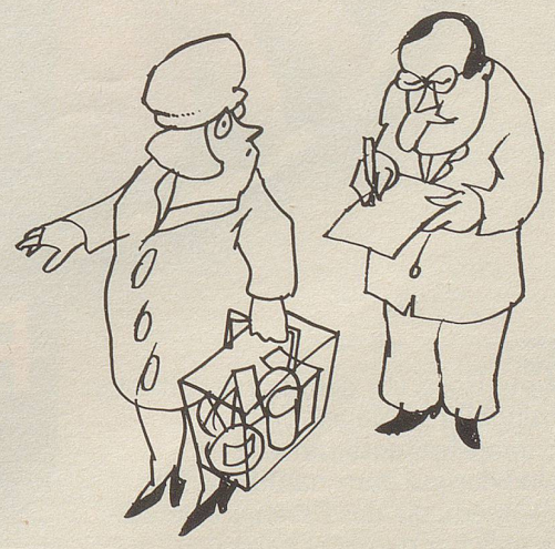
«Wir betreiben Marktforschung, gute Frau. Von Ihrem Konsumverhalten hängt es ab, ob wir in der Schweiz ein neues Wirtschaftssystem einführen oder nicht.»