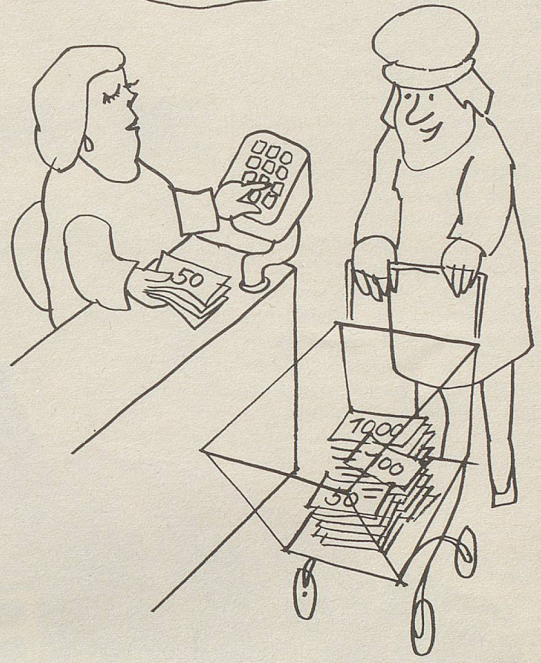
«Wie originell, dass ich nun in meinem Discount auch Geld sparen kann.»