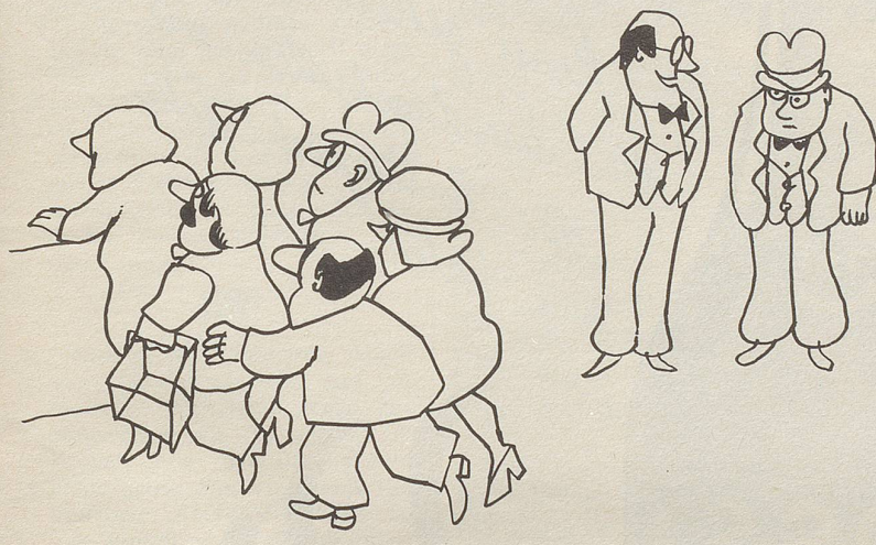
«Wir setzen von heute an ganz auf die Sparwut unserer Kunden.»