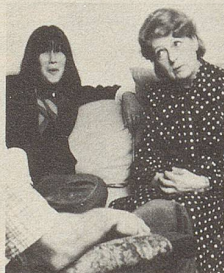
... beim Sprechen