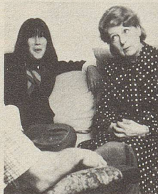
... beim Sprechen

Zürich: Oberdorfstrasse 24, 01 32 08 97 Interlaken: Am Bahnhofplatz, 036 22 32 32