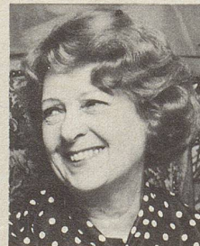
... beim Lachen