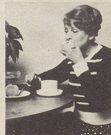
... beim Essen

Smig ist ein spezielles Haftkissen aus weichem Plastik, das leicht einzusetzen ist als Polster zwischen Kiefer und Prothese.