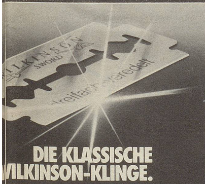
DIE KLASSISCHE WILKINSON-KLINGE.