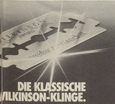
DIE KLASSISCHE WILKINSON-KLINGE.