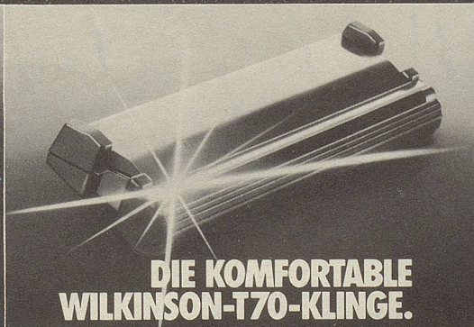
DIE KOMFORTABLE WILKINSON-T70-KLINGE.