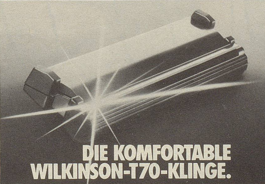
DIE KOMFORTABLE WILKINSON-T70-KLINGE.