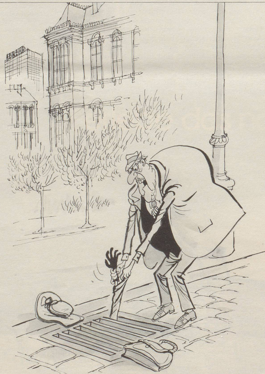
«Du mit deiner blöden Abmagerungskur!»