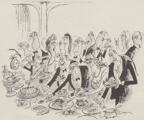
«Dummkopf – Diät hält man zu Hause!»

«Die Dicken leben zwar kürzer, aber sie essen länger.»