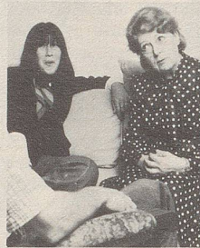
... beim Sprechen