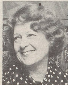
... beim Lachen