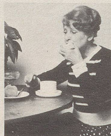
... beim Essen

Smig ist ein spezielles Haftkissen aus weichem Plastik, das leicht einzusetzen ist als Polster zwischen Kiefer und Prothese. Schmiegsam passt es sich der Form des Kiefers an, hält das Gebiss fest, ist hygienisch, völlig geruchlos und angenehm, sowie absolut unschädlich. Mit Smig schmerzt Ihr Zahnfleisch nicht mehr.