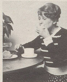
... beim Essen

Smig ist ein spezielles Haftkissen aus weichem Plastik, das leicht einzusetzen ist als Polster zwischen Kiefer und Prothese. Schmiegsam passt es sich der Form des Kiefers an, hält das Gebiss fest, ist hygienisch, völlig geruchlos und angenehm, sowie absolut unschädlich. Mit Smig schmerzt Ihr Zahnfleisch nicht mehr.