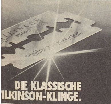
DIE KLASSISCHE WILKINSON-KLINGE.