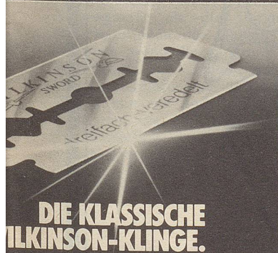
DIE KLASSISCHE WILKINSON-KLINGE.