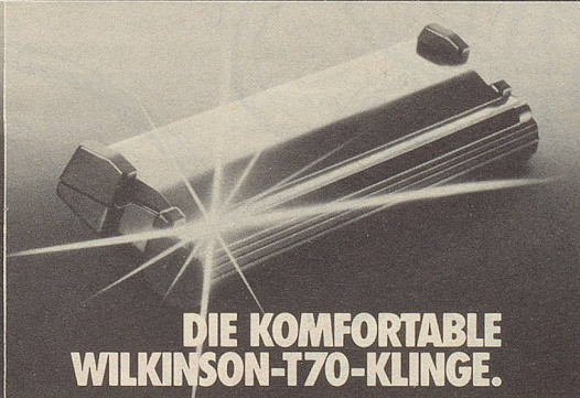
DIE KOMFORTABLE WILKINSON-T70-KLINGE.