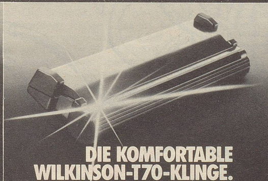
DIE KOMFORTABLE WILKINSON-T70-KLINGE.