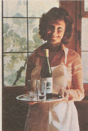
Anni vom «Kreuz».