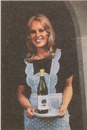
Margritli vom «Bären».

Wenn man durstig ist. Wenn es gemütlich ist. Dann ist es für immer mehr Leute der Apfelwein. Weil der Apfelwein schmeckt, wie er schmeckt.