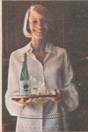
Vreni vom «Sternen».