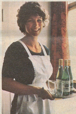
Rosy von der «Waldburg».