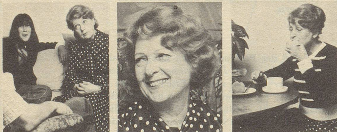
...beim Sprechen ...beim Lachen ...beim Essen