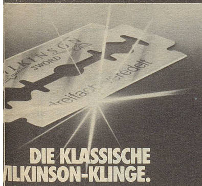
DIE KLASSISCHE WILKINSON-KLINGE.