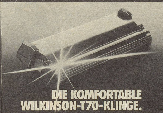
DIE KOMFORTABLE WILKINSON-T70-KLINGE.