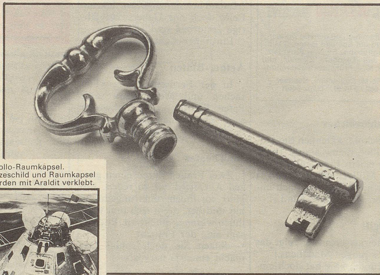
Apollo-Raumkapsel. Hitzeschild und Raumkapsel wurden mit Araldit verklebt.

Ein Schlüssel ohne Griffing ist kein Schlüssel... ...ausser man klebt ihn mit Araldit®.