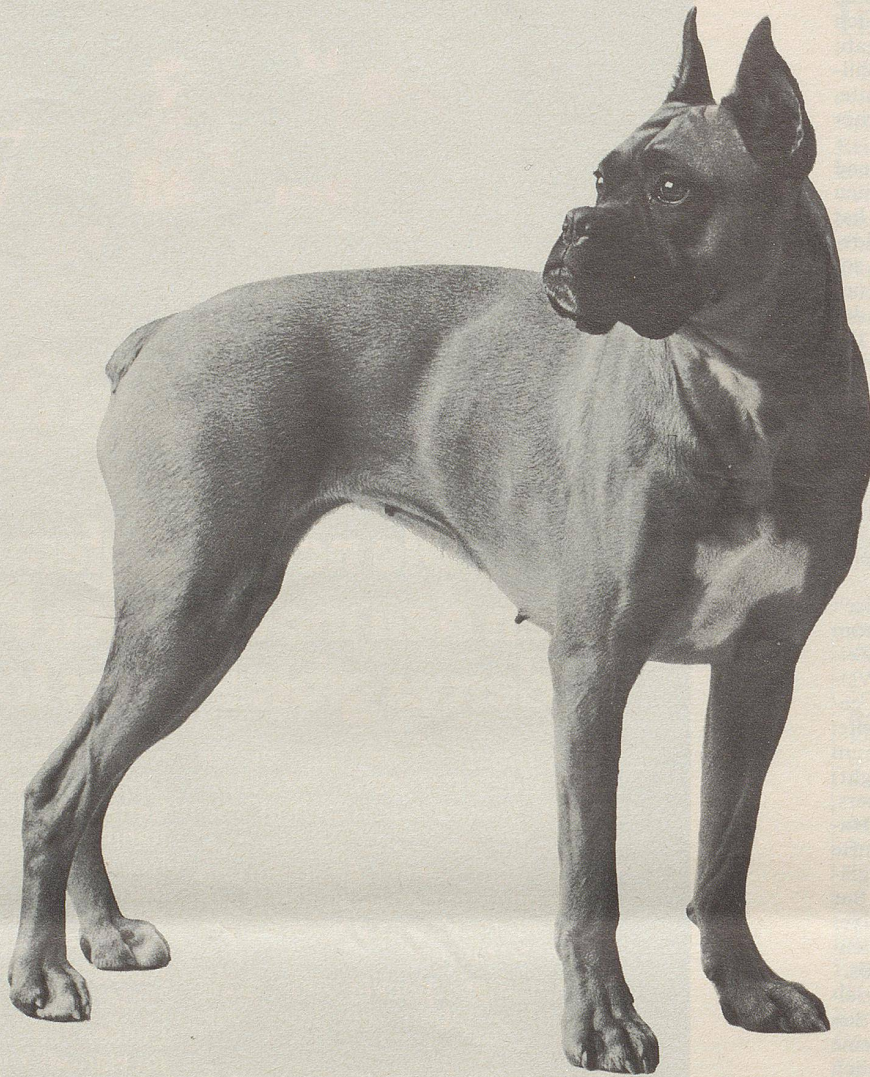
Dieser Boxer ist ein typischer Chappi-Hund: 2 1/2 Jahre alt; 25 kg schwer; schnittig; eleganter, gesunder Körperbau; kräftiger Kopf; dicke Lefzen. Hat Leistungsprüfungen bestanden.