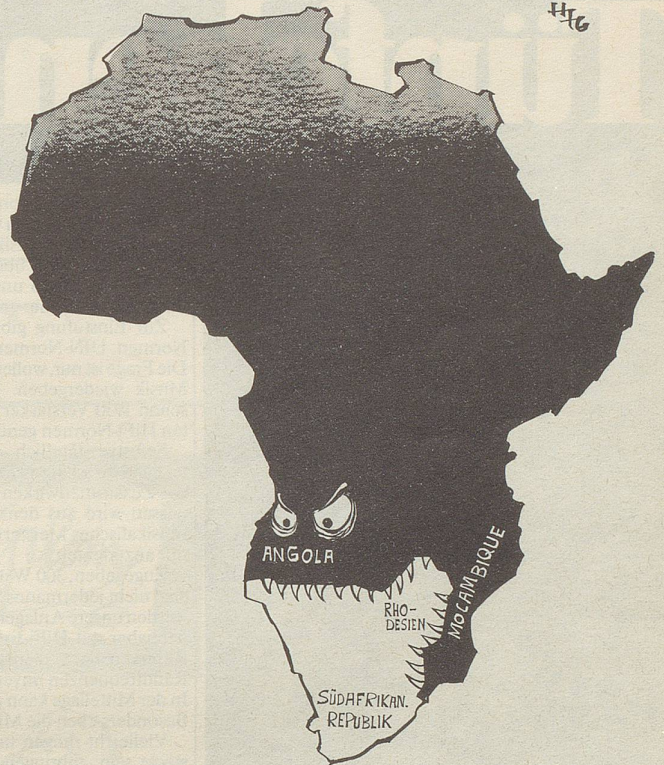
Der schwarze Hai