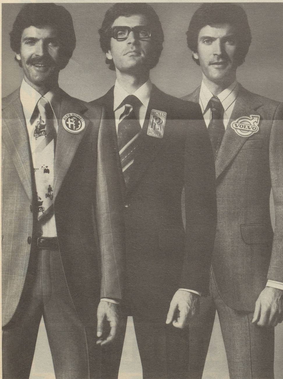
Die drei Top-Marken aus dem Kleider Frey-Angebot, von links: Euro Exklusiv, Konen, «cosmopolitan».

Kleider Frey, Fachgeschäft für Herren- und Knabenbekleidung