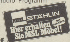
Bild: MSL-Studio-Programm beliebig zusammenstellbar

Über Geschmack lässt sich streiten. Darum haben wir in unserer grossen Ausstellung ein umfangreiches Angebot in den verschiedensten Stilarten ausgestellt. Hier finden auch Sie das Möbel, welches Ihren besonderen Vorstellungen entspricht. Auch eine Riesenauswahl an Orient- und Spannteppichen, Polstergruppen, Lampen, Einbauschränken und allem, was zum Wohnen gehört, macht unsere Fabrik-Ausstellung sehenswert.