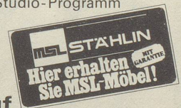
Bild: MSL-Studio-Programm beliebig zusammenstellbar

Über Geschmack lässt sich streiten. Darum haben wir in unserer grossen Ausstellung ein umfangreiches Angebot in den verschiedensten Stilarten ausgestellt. Hier finden auch Sie das Möbel, welches Ihren besonderen Vorstellungen entspricht. Auch eine Riesenauswahl an Orient- und Spannteppichen, Polstergruppen, Lampen, Einbauschränken und allem, was zum Wohnen gehört, macht unsere Fabrik-Ausstellung sehenswert.