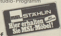
Bild: MSL-Studio-Programm beliebig zusammenstellbar

Über Geschmack lässt sich streiten. Darum haben wir in unserer grossen Ausstellung ein umfangreiches Angebot in den verschiedensten Stilarten ausgestellt. Hier finden auch Sie das Möbel, welches Ihren besonderen Vorstellungen entspricht. Auch eine Riesenauswahl an Orient- und Spannteppichen, Polstergruppen, Lampen, Einbauschränken und allem, was zum Wohnen gehört, macht unsere Fabrik-Ausstellung sehenswert.