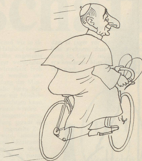
Eddy Merckx' Beitrag zur Linderung der vatikanischen Finanzmisere