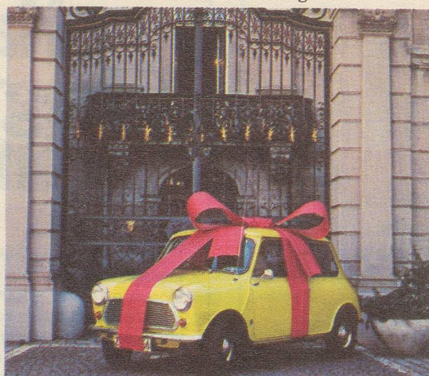
Ein willkommenes Geschenk für Leute, die gerne etwas auf die hohe Kante legen.