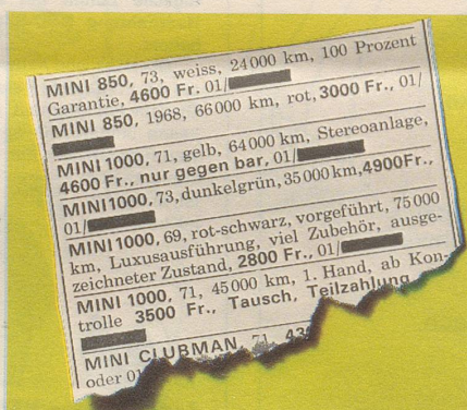
Oft erzielt er die höchsten Wiederverkaufspreise. In Ihrer Tageszeitung steht es schwarz auf weiss.