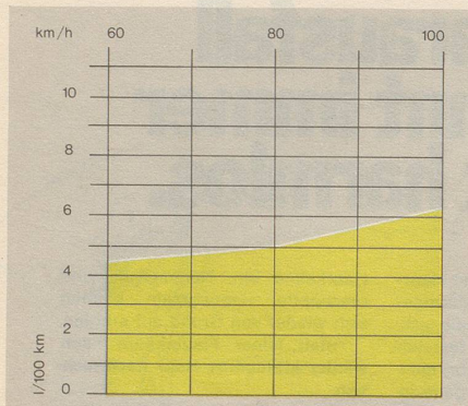
4 Personen Zürich-Genf retour für runde 30 Franken Benzin.