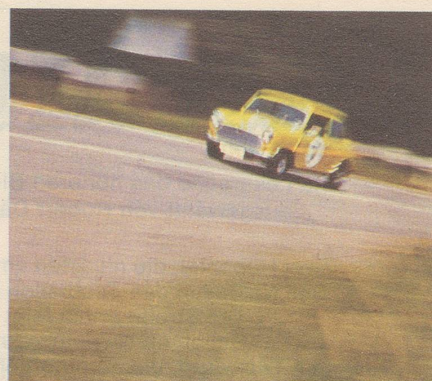
3 Siege im harten Monte-Carlo-Rallye. Weil er immer auf der Strasse, aber nie auf der Strecke bleibt.