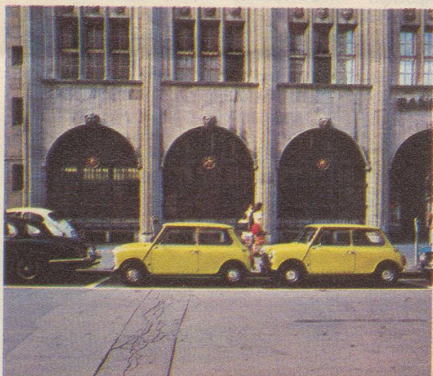
Wo er mit seinem Mini-Wendekreis (8,7m) einen Parkplatz besetzt, wird ein Parkplatz frei.