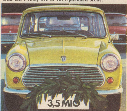
Ein Publikumsliedling mit englischem Charakter und internationalem Format.