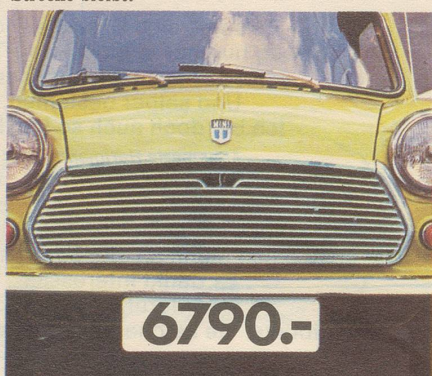
Steuer: Mini-mal Fr. 125.-. Versicherung: Mini-mal Fr. 422.10. Und ein Preis, wie er im Sparbuch steht.