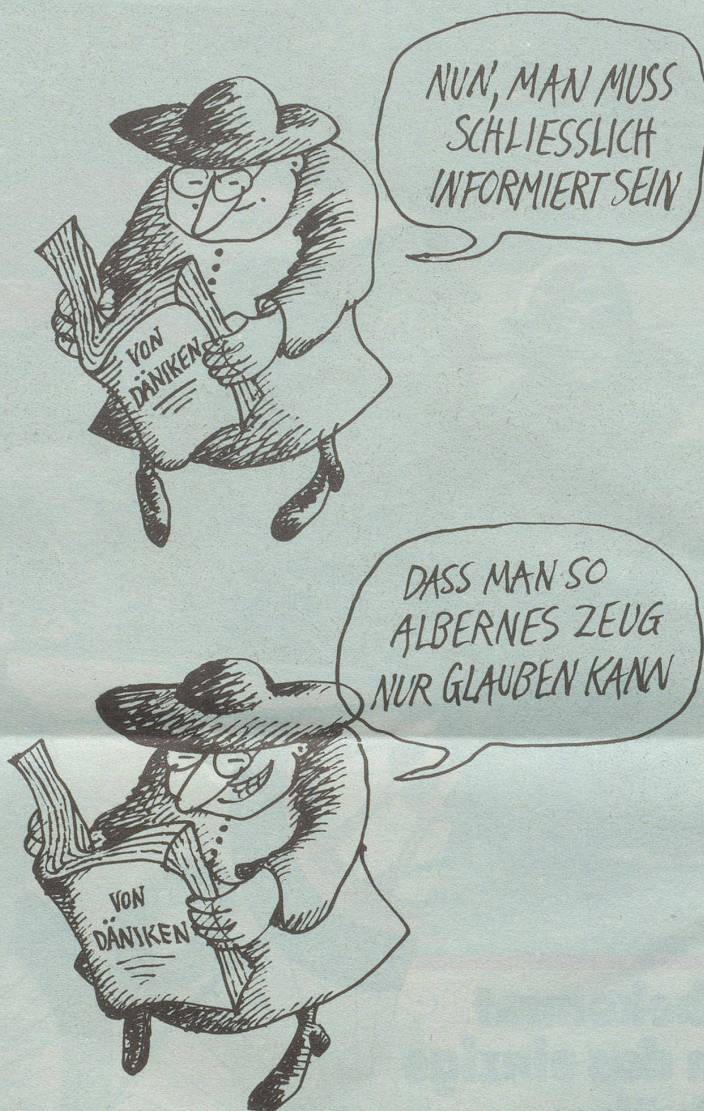
Die Gefahren der Bildung

Es gibt Witz ohne Humor. Es gibt aber kaum Humor ohne Witz. Arthur Schnitzler sagt: «Wer Humor hat, der hat beinahe schon Genie. Wer nur Witz hat, der hat meistens nicht einmal den.»