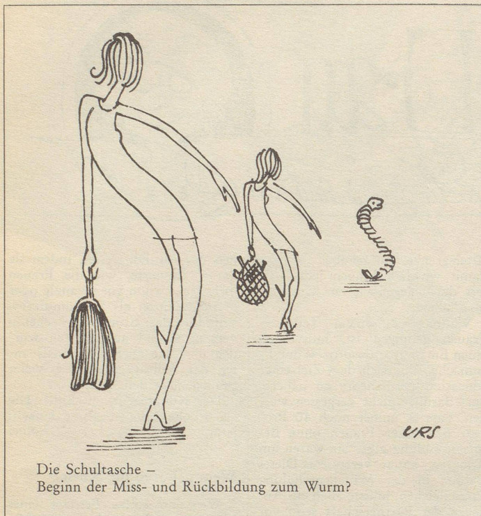
Die Schultasche – Beginn der Miss- und Rückbildung zum Wurm?

ein Schiesshund, wenn man von seinen eigenen Nüssen auch nur ein paar für sich selber haben will, und es scheint bei nussammelnden Mitmenschen als reine Frechheit angesehen zu werden, wenn man sie nicht frisch-fröhlich die ganze Ernte nach Hause tragen lässt! Kinder, ja, das kann ich begreifen, wenn die nicht widerstehen können und die dicken, köstlichen Dinger mitlaufen lassen und da drücke ich auch ein Auge, oder zwei, zu, aber als ich mit Stentorstimme einen älteren Mann, den ich zum dritten Mal mit Tüten bewaffnet beim «mausen» erwischte, zur Rede stellte, war der tief beleidigt und brummte beim Abzug was wie: «Blöds Wiibervolch, wäge dene paar Nuss» vor sich hin. Dabei platzten seine Tüten aus allen Nähten... Da gefiel mir der Bub schon besser, der, von meinem Mann erwischt, lachend erklärte: «Nuss si für all Lüt da!» Nach den Erfahrungen, die wir bis heute gemacht haben, hat er mit dieser Behauptung den Nagel auf den Kopf getroffen.