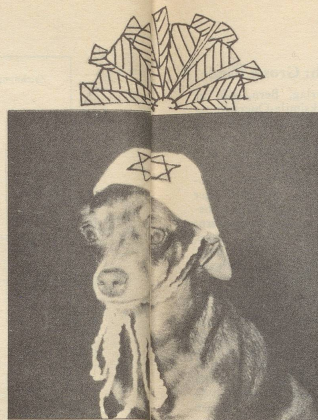
«Yamulka» in Weiss. Praktisch nach der Kopfwaschen.

Was schenkt man, wenn man selber auf dem Hund ist, auf Weihnachten seinem Hund (der schon alles hat)? Inspiriert von amerikanischen Hunde-Geschenk-Ratgebern macht Hans Moser einige zeitgemässe Anregungen: