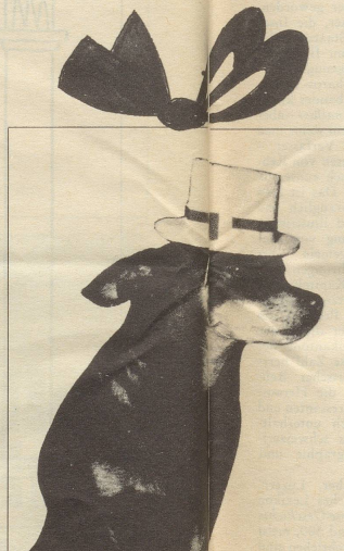
Leichter Sommerhut für wärmeempfindliche Hündinnen. Sehr schick!