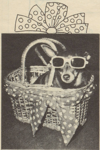
Sonnenbrillen, verstellbar. Für empfindliche Hunde in Polaroid. In den Farben Gelb, Blau und Rosa.