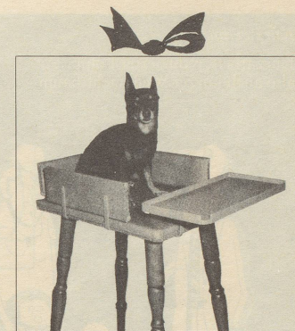
Hündli-Hochstuhl mit Klapptrich zum Essen oder Spielen.