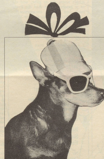
Manchester-Mütze mit angeknöpfter Sonnenbrille für die Begleitung des sporttreibenden Meisters.