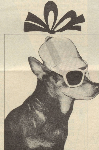
Manchester-Mütze mit angeknöpfter Sonnenbrille für die Begleitung des sporttreibenden Meisters.