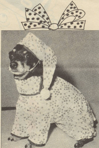
Hunde-Pyjama mit dazu passender Schlafmütze. Ideal für Rüden, die in kalten Nächten auf Streife gehen. Passend auch für Hunde, die mit den Kindern schlafen. Verschiedene Dessins.