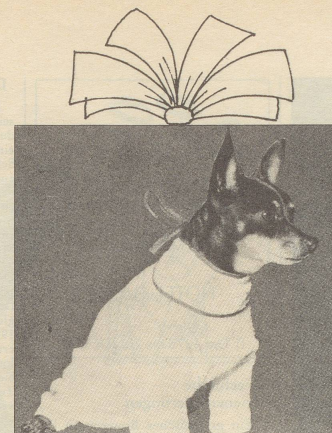
Für die ersten Morgenstunden und die Hausgeschäfte adretter Bademantel, weiss mit roten Bordüren. Waschbar.