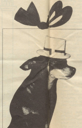
Leichter Sommerhut für wärmeempfindliche Hündinnen. Sehr schick!