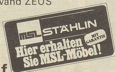
Bild: Wohnwand ZEUS

Über Geschmack lässt sich streiten. Darum haben wir in unserer grossen Ausstellung ein umfangreiches Angebot in den verschiedensten Stilarten ausgestellt. Hier finden auch Sie das Möbel, welches Ihren besonderen Vorstellungen entspricht. Auch eine Riesenauswahl an Orient- und Spannteppichen, Polstergruppen, Lampen, Einbauschränken und allem, was zum Wohnen gehört, macht unsere Fabrik-Ausstellung sehenswert.