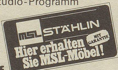
Bild: MSL-Studio-Programm beliebig zusammenstellbar

Über Geschmack lässt sich streiten. Darum haben wir in unserer grossen Ausstellung ein umfangreiches Angebot in den verschiedensten Stilarten ausgestellt. Hier finden auch Sie das Möbel, welches Ihren besonderen Vorstellungen entspricht. Auch eine Riesenauswahl an Orient- und Spannteppichen, Polstergruppen, Lampen, Einbauschränken und allem, was zum Wohnen gehört, macht unsere Fabrik-Ausstellung sehenswert.