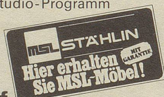
Bild: MSL-Studio-Programm beliebig zusammen- stellbar

Über Geschmack lässt sich streiten. Darum haben wir in unserer grossen Ausstellung ein umfangreiches Angebot in den verschiedensten Stilarten ausgestellt. Hier finden auch Sie das Möbel, welches Ihren besonderen Vorstellungen entspricht. Auch eine Riesenauswahl an Orient- und Spannteppichen, Polstergruppen, Lampen, Einbauschränken und allem, was zum Wohnen gehört, macht unsere Fabrik-Ausstellung sehenswert.