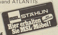
Bild: Wohnwand ATLANTIS beliebig zusammenstellbar

Über Geschmack lässt sich streiten. Darum haben wir in unserer grossen Ausstellung ein umfangreiches Angebot in den verschiedensten Stilarten ausgestellt. Hier finden auch Sie das Möbel, welches Ihren besonderen Vorstellungen entspricht. Auch eine Riesenauswahl an Orient- und Spannteppichen, Polstergruppen, Lampen, Einbauschränken und allem, was zum Wohnen gehört, macht unsere Fabrik-Ausstellung sehenswert.