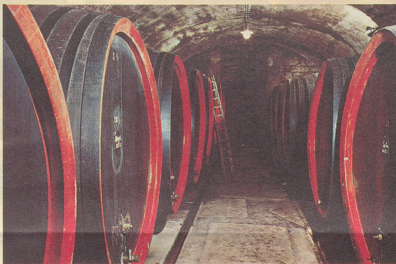
In grossen Fässern aus edlen Hölzern reift der Wein seiner Blüte entgegen