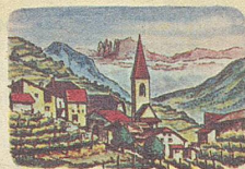
St. Magdalena hat dem Wein aus der Umgebung seinen Namen geschenkt

Neugierige Weinbeisser probieren ihn gerne jung und frisch. Sie machen es wie wir Kellermeister, sie halten das tropfenförmig geschwungene Weinglas gegen das Licht, freuen sich an leuchtender Farbe und reiner Klarheit, atmen tief den Duft ein und «kauen» bedächtig ein Tröpfchen auf der Zunge. Erst dann folgt ein langsamer