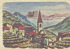
St. Magdalena hat dem Wein aus der Umgebung seinen Namen geschenkt

Neugierige Weinbeisser probieren ihn gerne jung und frisch. Sie machen es wie wir Kellermeister, sie halten das tropfenförmig geschwungene Weinglas gegen das Licht, freuen sich an leuchtender Farbe und reiner Klarheit, atmen tief den Duft ein und «kauen» bedächtig ein Tröpfchen auf der Zunge. Erst dann folgt ein langsamer