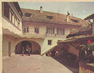
Hof einer typischen Südtiroler Weinkellerei