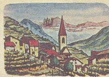
St. Magdalena hat dem Wein aus der Umgebung seinen Namen geschenkt

Neugierige Weinbeisser probieren ihn gerne jung und frisch. Sie machen es wie wir Kellermeister, sie halten das tropfenförmig geschwungene Weinglas gegen das Licht, freuen sich an leuchtender Farbe und reiner Klarheit, atmen tief den Duft ein und «kauen» bedächtig ein Tröpfchen auf der Zunge. Erst dann folgt ein langsamer