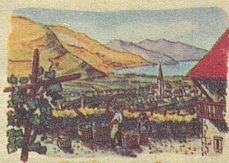
Um den Kalterersee liegt ein weites Weinparadies

Schluck, der den wahren Körper des Weines ergründet. Der Kalterer zum Beispiel, der in den ausgedehnten und sonnenbegünstigten Weingärten des