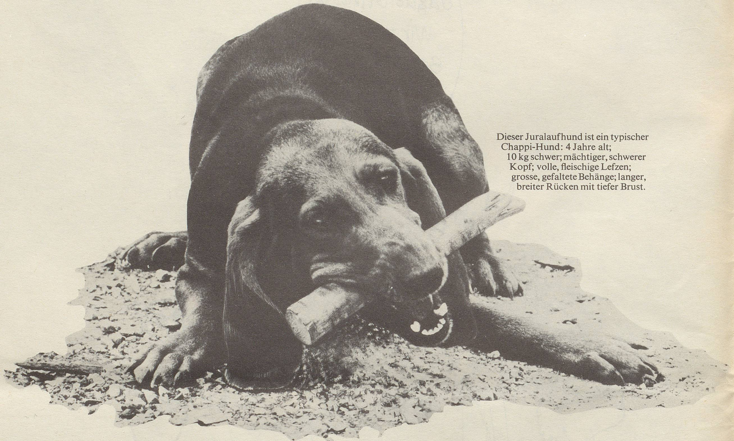
Dieser Juralaufhund ist ein typischer Chappi-Hund: 4 Jahre alt; 10 kg schwer; mächtiger, schwerer Kopf; volle, fleischige Lippen; grosse, gefaltete Behänge; langer, breiter Rücken mit tiefer Brust.