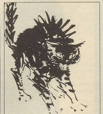
WAAGHAUS ST. GALLEN

Antwort: Im Prinzip schon; er probiert augenblicklich den Ritt auf dem Tiger. Diffusor Fadinger