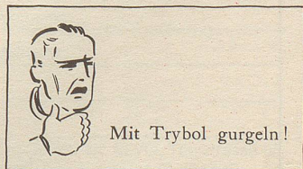
Mit Trybol gurgeln!