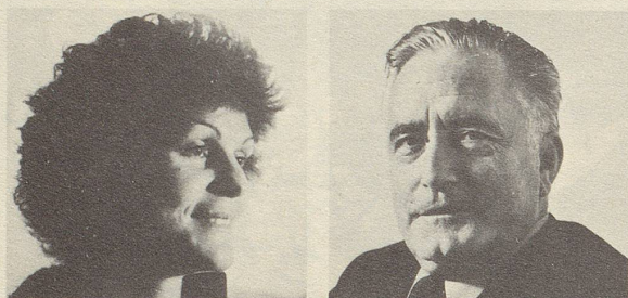
Georges André Chevallaz Bundesrat