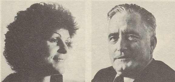
Georges André Chevallaz Bundesrat