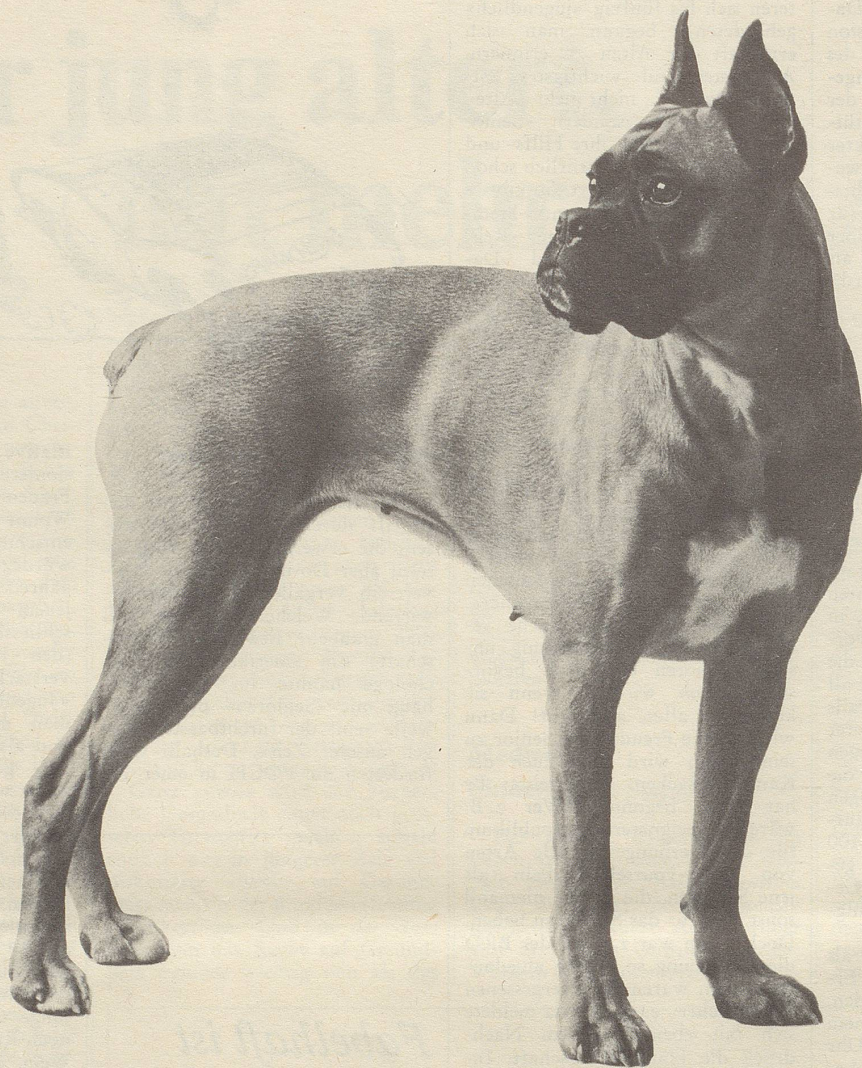
Dieser Boxer ist ein typischer Chappi-Hund: 2 1/2 Jahre alt; 25 kg schwer; schnittig; eleganter, gesunder Körperbau; kräftiger Kopf; dicke Lefzen. Hat Leistungsprüfungen bestanden.