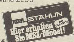
Bild: Wohnwand ZEUS

Über Geschmack lässt sich streiten. Darum haben wir in unserer grossen Ausstellung ein umfangreiches Angebot in den verschiedensten Stilarten ausgestellt. Hier finden auch Sie das Möbel, welches Ihren besonderen Vorstellungen entspricht. Auch eine Riesenauswahl an Orient- und Spannteppichen, Polstergruppen, Lampen, Einbauschränken und allem, was zum Wohnen gehört, macht unsere Fabrik-Ausstellung sehenswert.