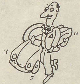
Tänk a d Promille!

dern mit «Gezondheit» durchkommt, bei Baslern mit «uff dy Wohl!», bei Zürchern mit «es Pröschtli!» und bei Bernern scheint's mit dem Wortbandwurm «Potz-zytloggenuchichäschtiabenangereiztgeitslos!» In Klammer wird allerdings vermerkt: «Wenn's ums Trinken geht, verstehen die meisten Ihrer Gäste freilich auch Zeichensprache.»