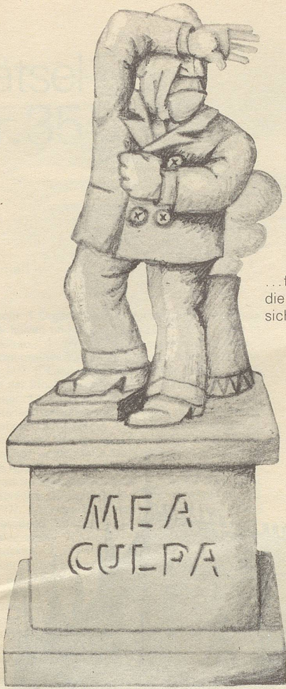
... für Magistraten, die offen zugeben, sich geirrt zu haben