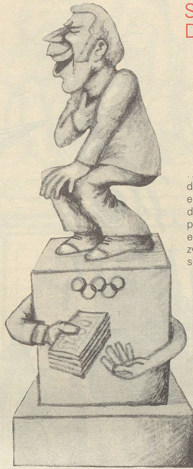
... für IOK-Mitglieder, die freimütig einräumen, dass der Amateur- paragraph ein Witz – und zwar ein schlechter – sei