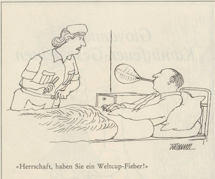
«Herrschaft, haben Sie ein Weltcup-Fieber!»