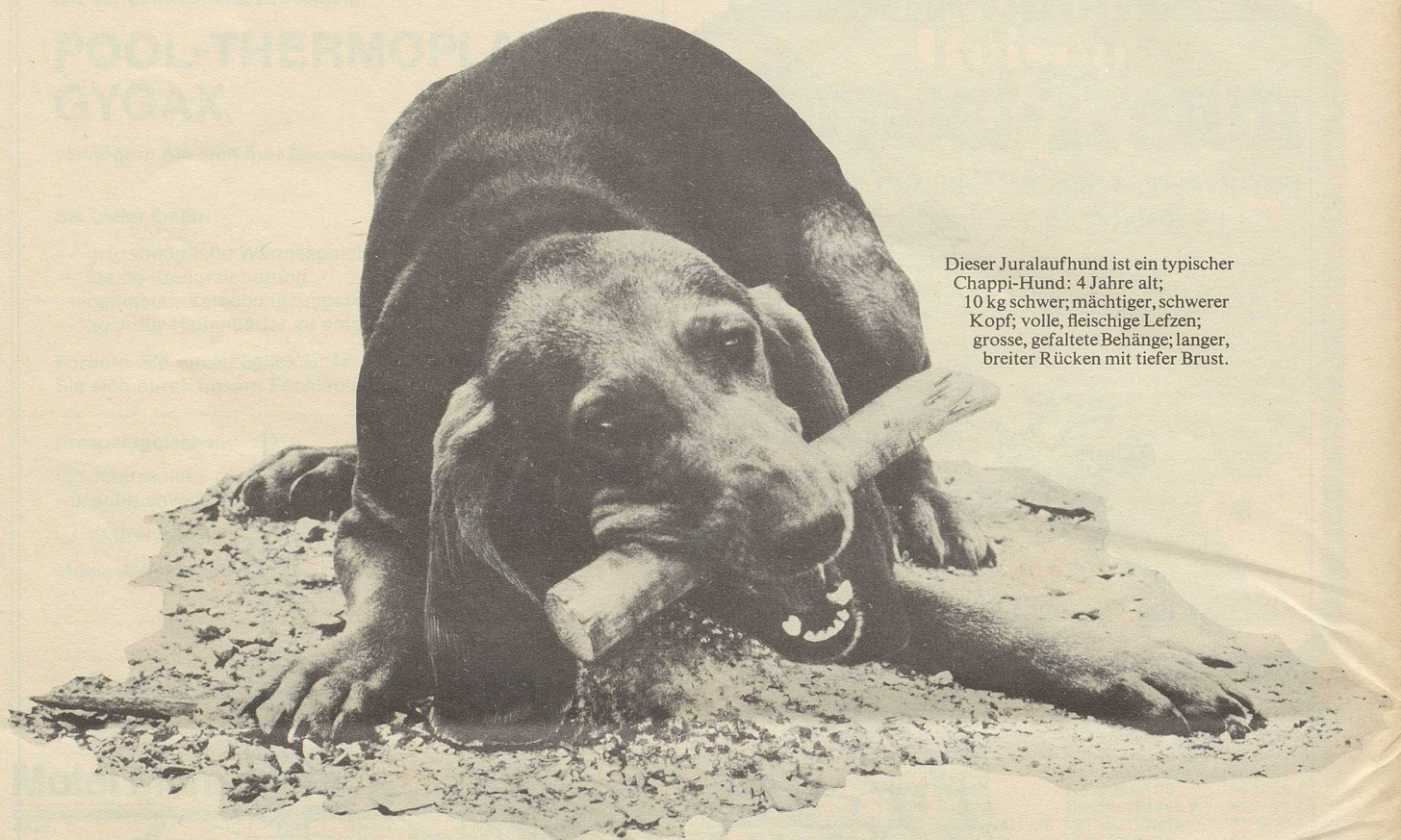
Dieser Juralaufhund ist ein typischer Chappi-Hund: 4 Jahre alt; 10 kg schwer; mächtiger, schwerer Kopf; volle, fleischige Lefzen; grosse, gefaltete Behänge; langer, breiter Rücken mit tiefer Brust.