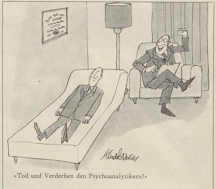
«Tod und Verderben den Psychoanalytikern!»