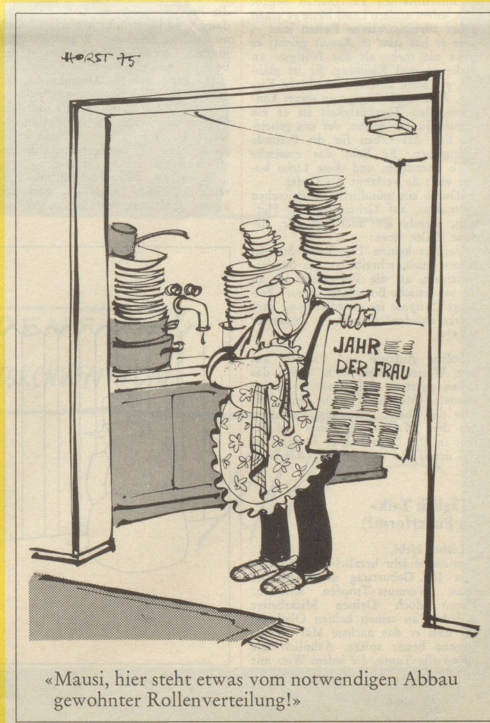
«Mausi, hier steht etwas vom notwendigen Abbau gewohnter Rollenverteilung!»

Regina Resnik: «Leonard Bernstein springt nicht am Dirigentenpult, es springt in ihm.» Vox