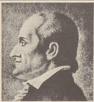
Adolf Freiherr von Knigge, geb. 1752, Verfasser des «Traktates praktischer Lebensphilosophie, einer scharfsinnigen und eleganten, kritischen und amüsanten, bis heute modern gebliebenen Welt- und Menschenkunde»

über den Umgang mit Frauenzimmern, aber keines über deren Umgang mit Menschen. Er hat nichts gegen jene, welche er gelegentlich auch Weiber oder Frauen oder Damen nennt, aber er meint, dass «die Frau eigentlich gar keine Person in der bürgerlichen Gesellschaft ausmacht», und er fühlt sich ihr gegenüber unzuständig, denn «weise Frauenzimmer allein» könnten ihr «die besten Lehren über ihr Betragen im gesellschaftlichen Leben erteilen».