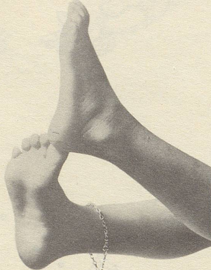
...oder kleine flinke...