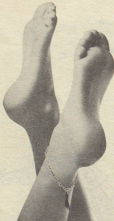
ganz feine zarte...