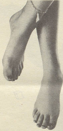
...oder ganz enthemmte...