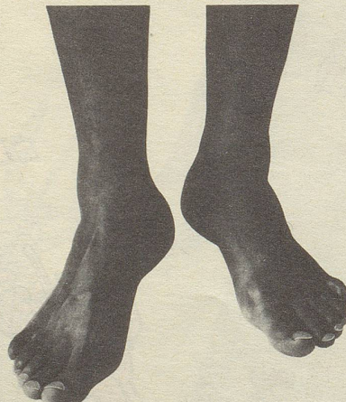
...oder sehnige harte: