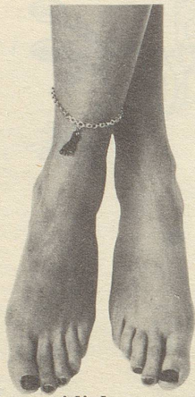
Ob nun zwei linke...