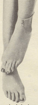
...und chronisch kalte...