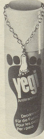
Ein Füßchen* in Ehren kann kein gepflegter Fuss verwehren.

* Das yegi-Füßchen am Fuss trägt man als Zeichen dafür, dass man dank täglicher Pflege mit dem yegi-Fuss-Antitranspirant auf frischem Fusse zu leben versteht, den eigenen zehn Zehen neuen Schwung, Temperament, Bewegungsfreude und frischen Elan zu verleihen weiss und diese erst noch den ganzen Tag schön frisch und sicher auf Trab hält.