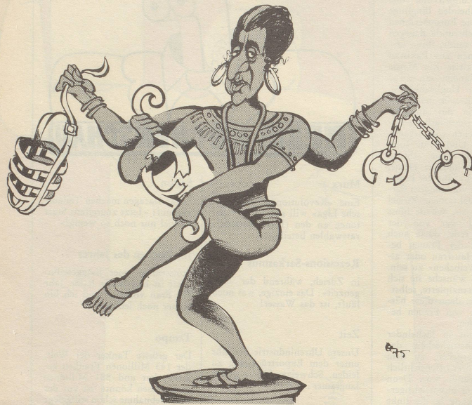
Indischer Schiwa, 20. Jahrhundert