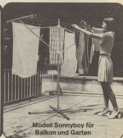
Modell Sonnyboy für Balkon und Garten