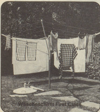
Waschschüssel First Class

Name/Vorname _____ Strasse/Nr. _____ PLZ/Ort _____ Gölg Ade AG, Metallbau, 8050 Zürich, Siewerdstrasse 95, Telefon 01 - 46 70 44