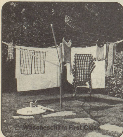
Wascheschirm First Class

Götz Ade AG, Metallbau, 8050 Zürich, Siewerdstrasse 95, Telefon 01 - 46 70 44