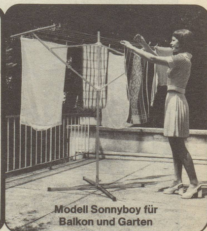
Modell Sonnyboy für Balkon und Garten