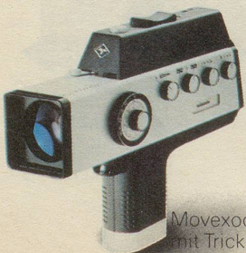
Movexoom 4000 mit Trickknopf!