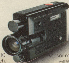
Microflex 300 Superflach.