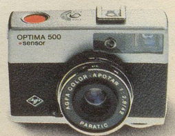
Optima 500 Sensor macht die Bilder verwackelsicherer!