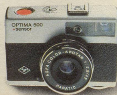
Optima 500 Sensor macht die Bilder verwackelsicherer!