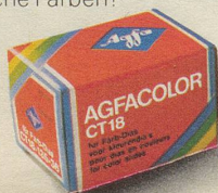
Agfacolor CT18 Natürliche Farben!