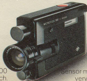
Microflex 300 Superflach.