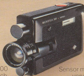
Microflex 300 Superflach.