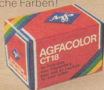
Agfacolor CT18 Natürliche Farben!