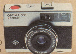
Optima 500 Sensor macht die Bilder verweckelsicherer!