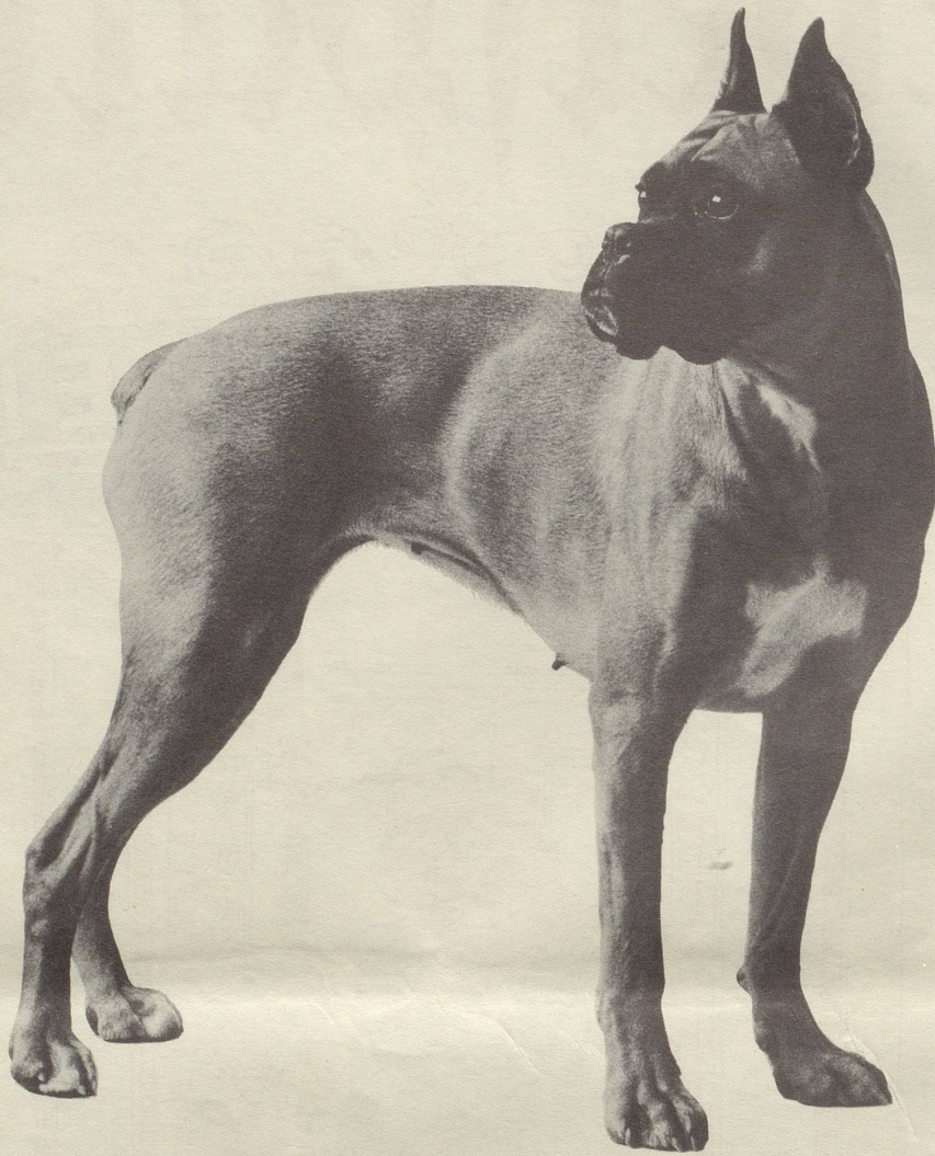
Dieser Boxer ist ein typischer Chappi-Hund: 2 1/2 Jahre alt; 25 kg schwer; schnittig; eleganter, gesunder Körperbau; kräftiger Kopf; dicke Lefzen. Hat Leistungsprüfungen bestanden.