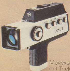
Movexoom 4000 mit Trickknopf!