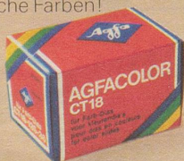
Agfacolor CT18 Natürliche Farben!