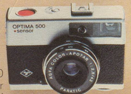
Optima 500 Sensor macht die Bilder verweckelsicherer!